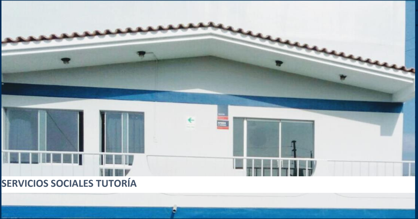
SERVICIOS SOCIALES TUTORÍA