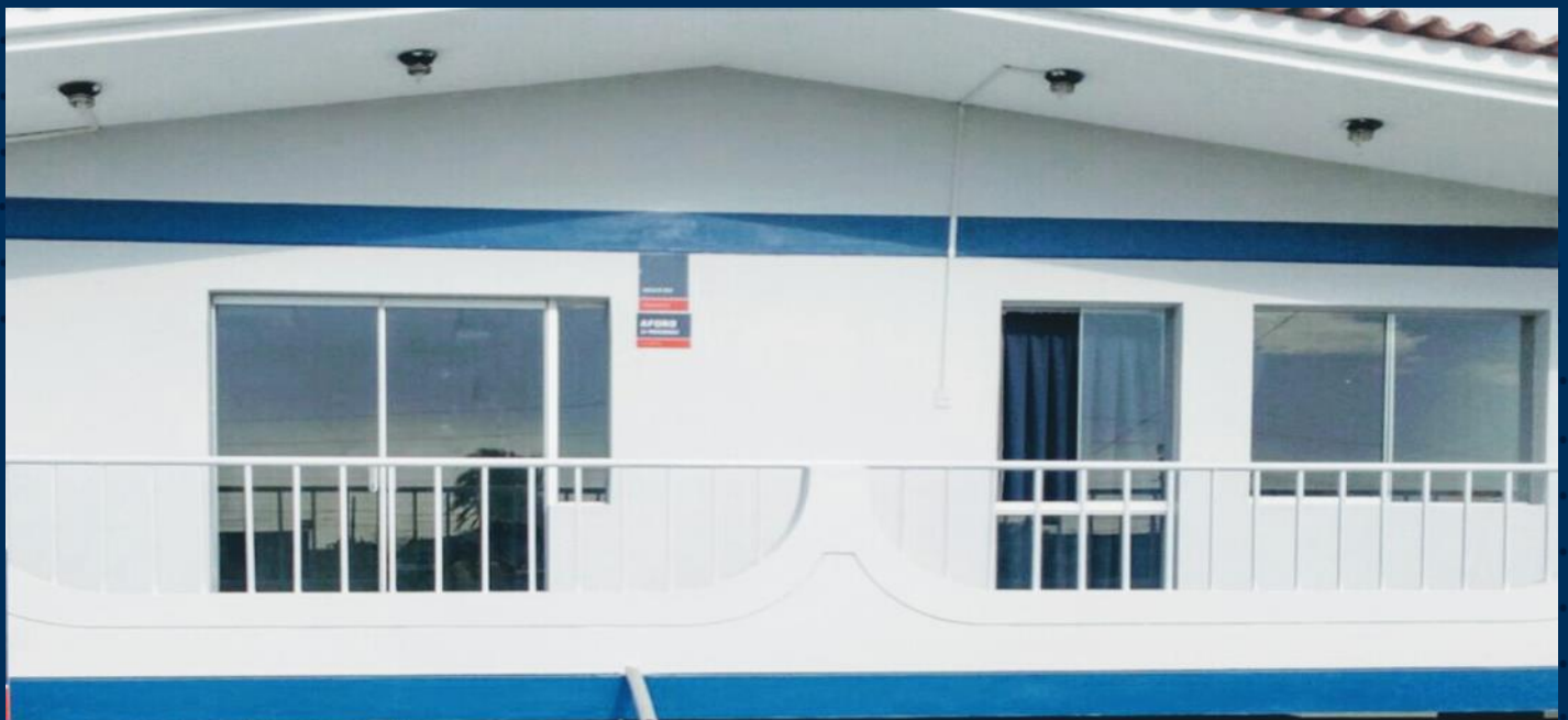
SERVICIOS SOCIALES: TRABAJO SOCIAL / ESCUELA DE PADRES