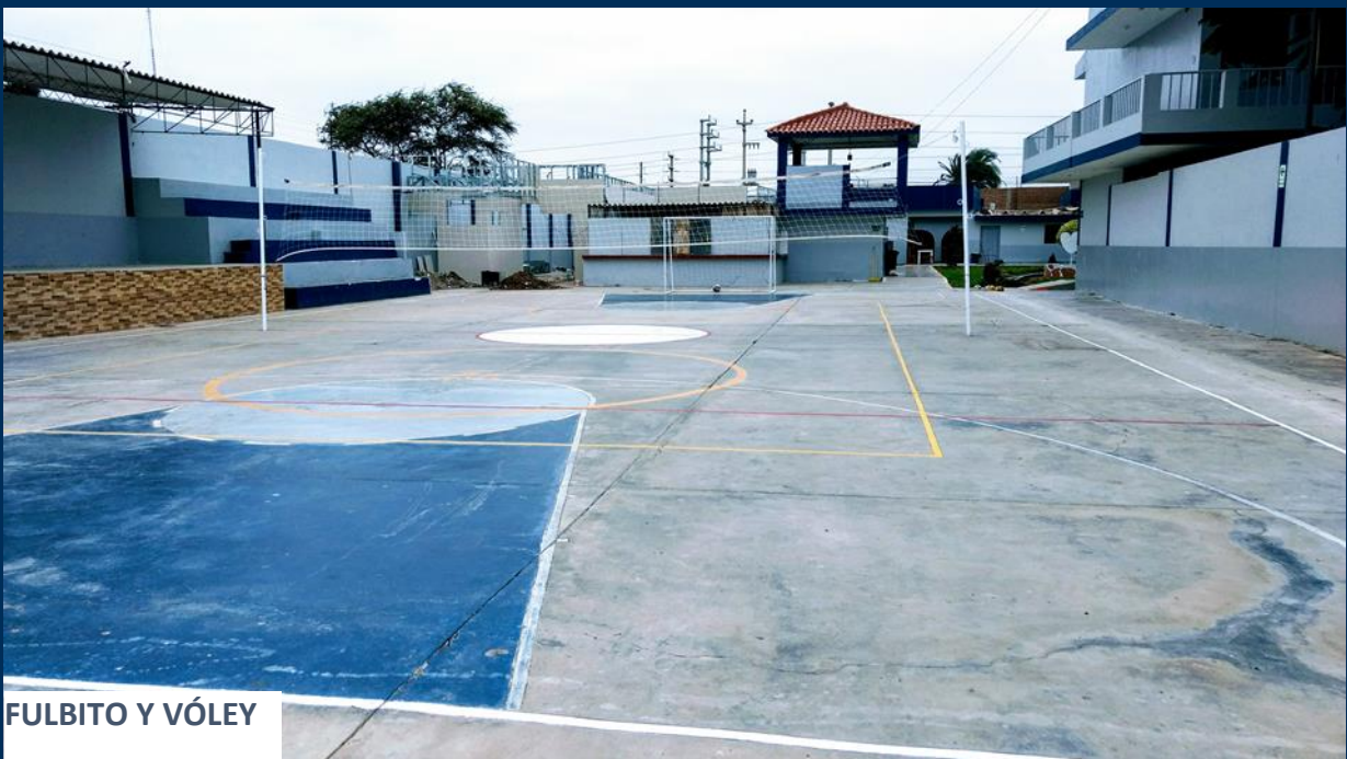
FULBITO Y VÓLEY